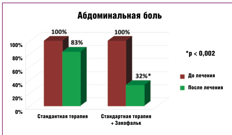
Рис. 4. Динамика полного исчезновения абдоминальной боли у пациентов с СРК при применении стандартной терапии и в комбинации с Закофальком

представляется весьма перспективным. В литературе имеются данные об эффективности Закофалька. Так, по данным одного двойного, слепого, рандомизированного и плацебо-контролируемого исследования показана статистически достоверная эффективность препарата по сравнению с плацебо в отношении купирования болевого синдрома и нормализации стула [57]. Помимо противовоспалительного действия бутират, возможно, снижает висцеральную гиперчувствительность толстой кишки [58], что еще больше расширяет возможности его применения при СРК. Снижение висцеральной гиперчувствительности при использовании бутирата, возможно, происходит путем модуляции