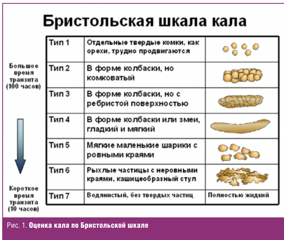
Рис. 1. Оценка кала по Бристольской шкале