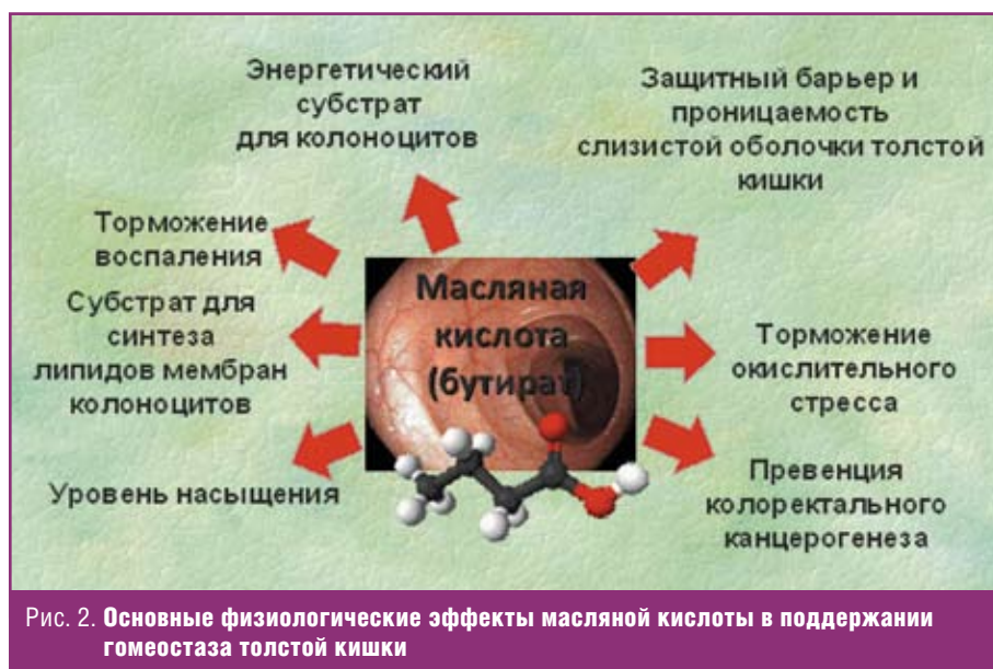
Рис. 2. Основные физиологические эффекты масляной кислоты в поддержании гомеостаза толстой кишки

ток, секретирующих серотонин (это вызывает усиление моторики), а также скопление тучных клеток и их дегрануляция в зоне нервных окончаний (это изменяет восприятие боли) [9–12].